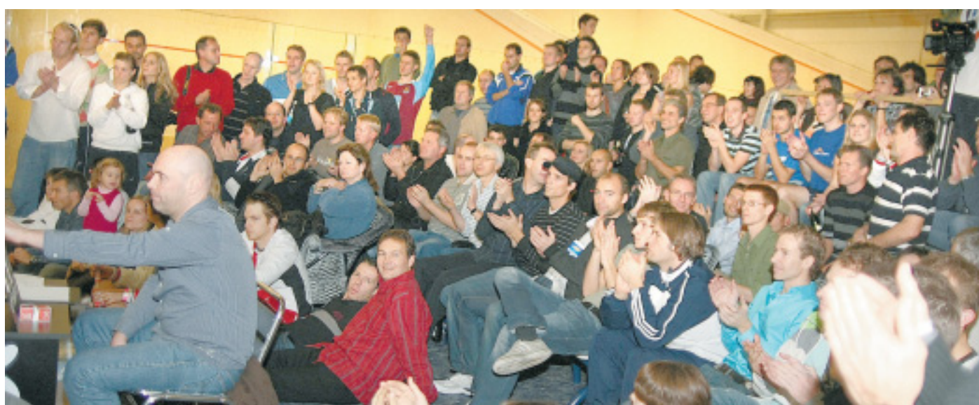
Applaus, Applaus: Viele Zuschauer im Löhner Kaiser-Center verfolgten die Spiele am Samstag, dem Final-Tag, hier vor dem Squash-Court.